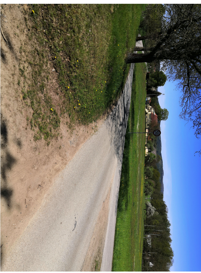
Pohled vlevo směrem do Holašovic