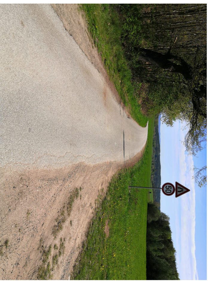
Pohled vpravo směrem do Čakova

Na konci se cesta napojuje na stávající místní komunikaci do Holašovic. Na této cestě je je snížena dovolená rychlost na 50 km/h. Rozhledové poměry jsou posouzeny dle ČSN 7361:09 čl. 11.2.1 pro rychlost v=50 km/h s odsazením rozhledu z polní cesty 3 m. Rozhledové poměry vyhovují za předpokladu vykáčení 3 dubů. Kácení bude provedeno v rámci stavby.